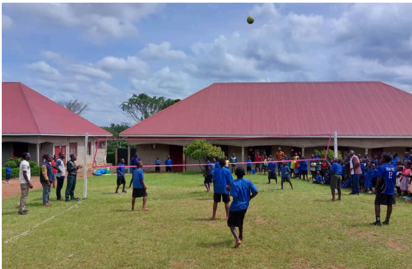
Het volleybalnet met de gloednieuwe ijzeren palen! Daar zullen de leerlingen nog veel plezier van hebben.