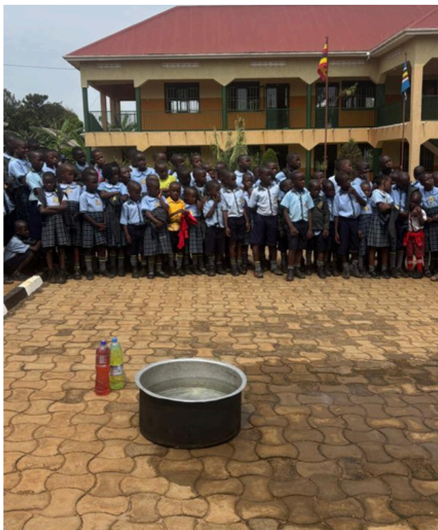
Alles wordt klaargezet voor de brandoefening.