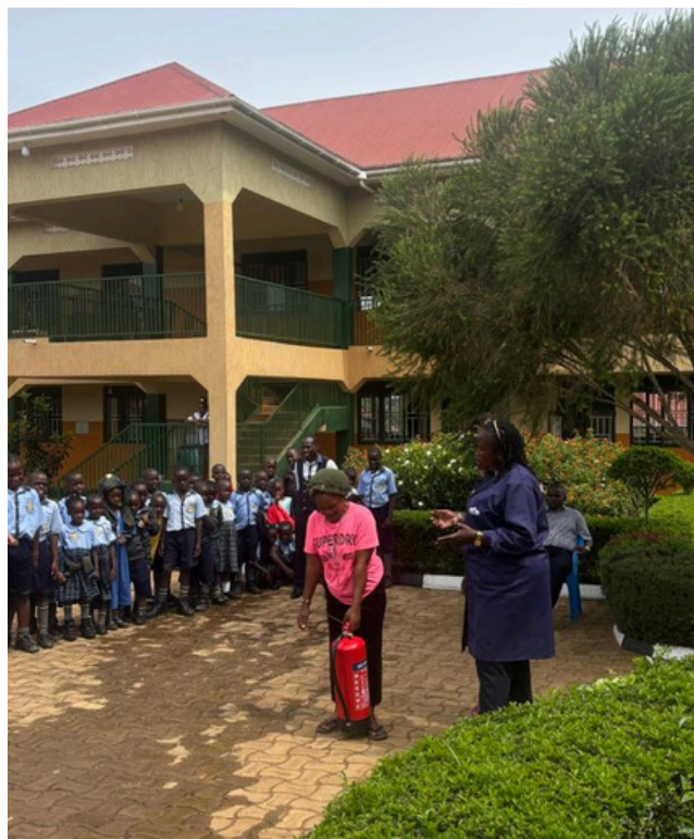
Instructies worden gegeven voor het gebruik van een brandblusapparaat.