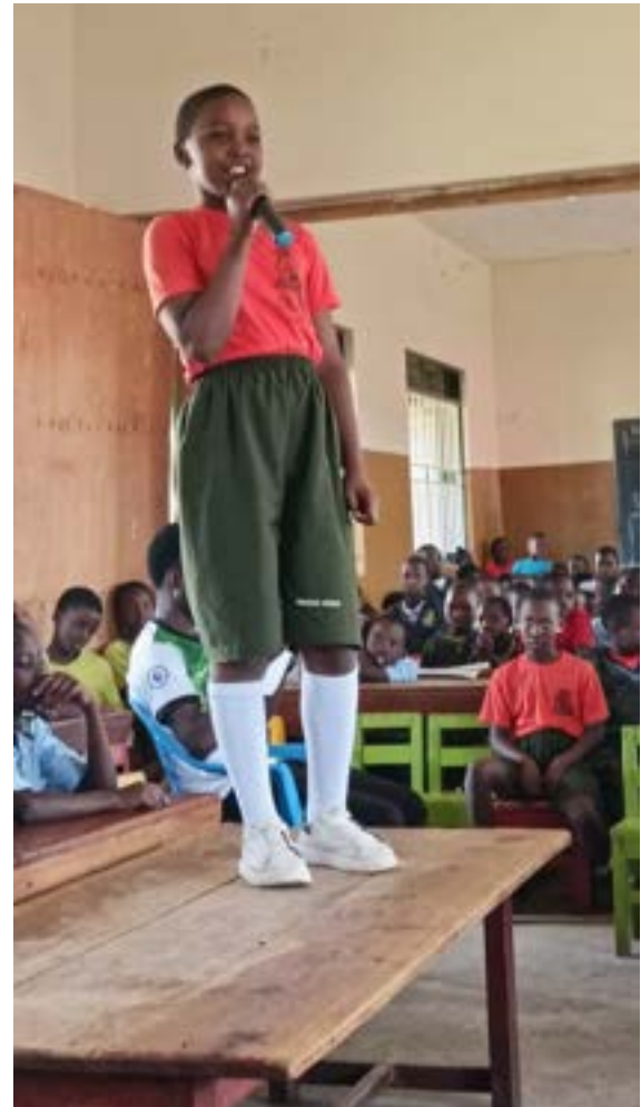
het gaat er ernstig aan toe, met heel wat moeilijke vragen uit het 'publiek'